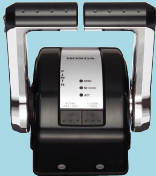
Honda iST DriveByWire (Dubbel)