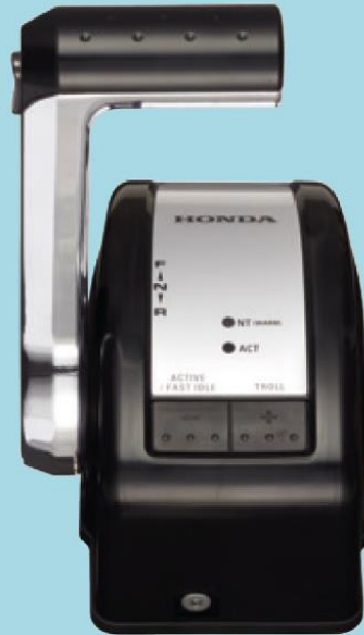
Honda iST DriveByWire (Singel)

Alla V6-motorer (förutom BF175) kan fås med mekaniska kontroller.