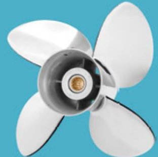
4-bladig rostfri stålpropeller