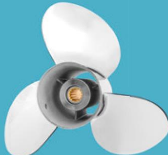
3-bladig rostfri stålpropeller