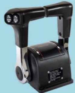
Toppmonterat fjärreglage (dubbel)