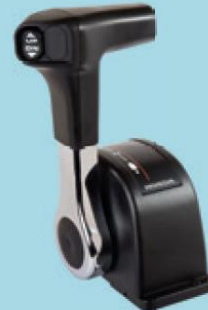
Toppmonterat fjärreglage (Singel)