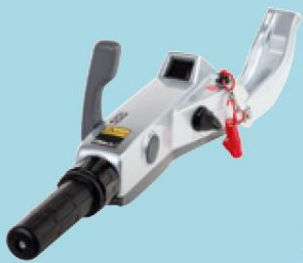
Multifunktions-rorkult (BF40D och BF50D)